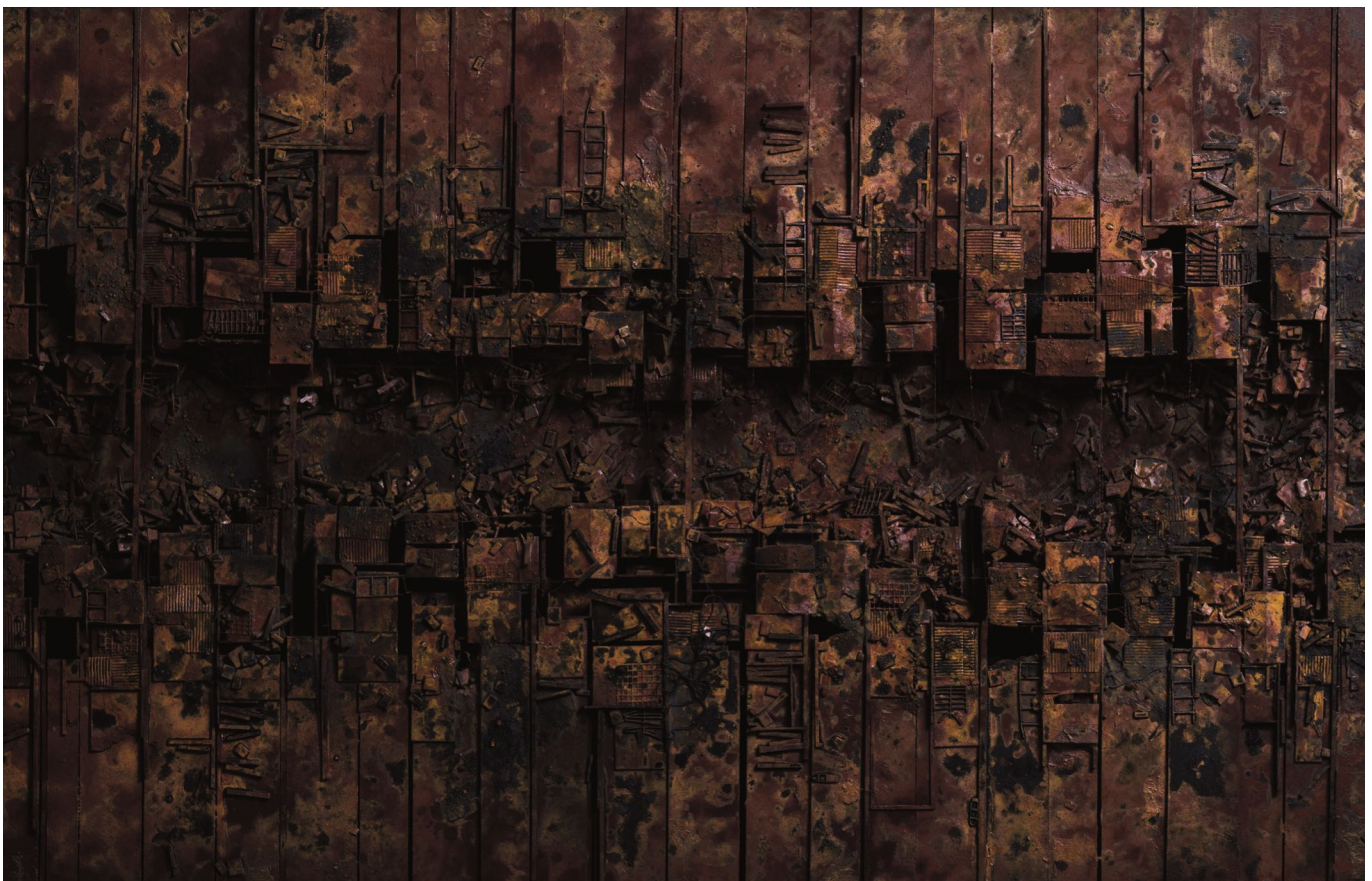
Hendrik CZAKAINSKI , The Ditch , 2022, technique mixte sur bois, 77 x 122 x 5 cm