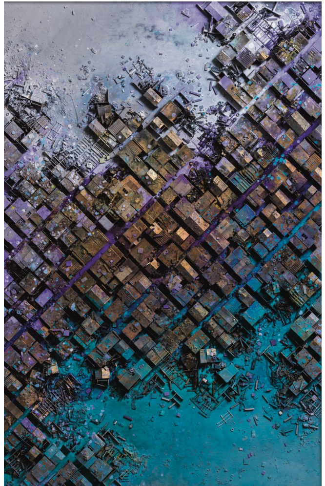
Hendrik CZAKAINSKI , Sea Wall , 2022, technique mixte sur bois, 155 x 106 x 5 cm