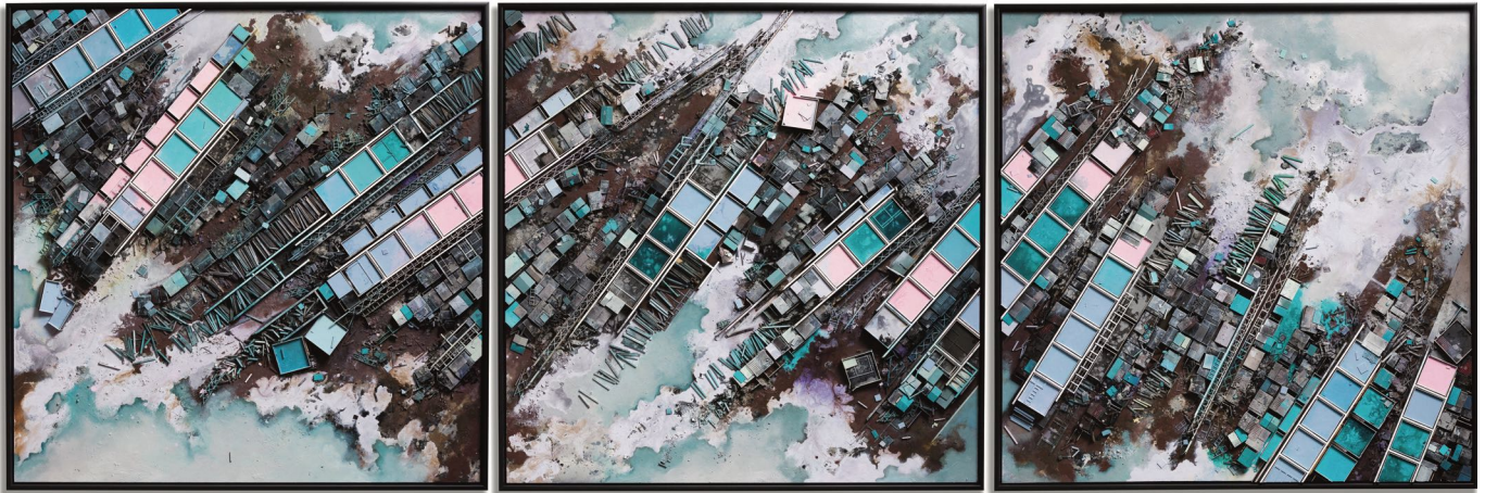
Hendrik CZAKAINSKI , Technosphere , 2022, technique mixte sur bois, triptyque, 144 x 436 x 5 cm

La technosphère est la partie de l'environnement fabriquée ou modifiée par l'homme pour être utilisée dans les activités humaines et les habitats humains. En plus de l'industrialisation, de l'extraction minière, de la pollution, de la déforestation, de la guerre, du nucléaire, il s'agit aussi des systèmes informatiques dont Internet, des satellites dans l'espace, du développement urbain, des systèmes de transport... Hendrik Czakainski s'en inspire largement dans ses œuvres en trois dimensions, où ordre et chaos s'harmonisent avec une habileté rare.