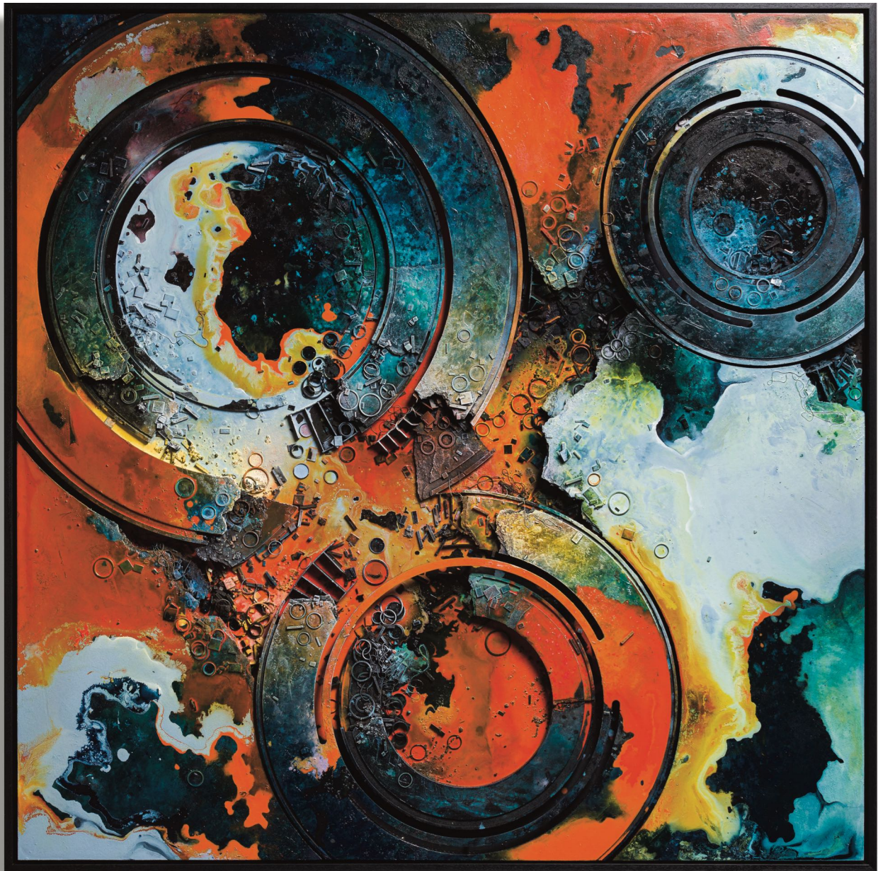
Hendrik CZAKAINSKI, Circle Crash , 2022, technique mixte sur bois, 145 x 145 x 5 cm

Comme s'il revenait à ses premières amours de peintre, il s'intéresse aujourd'hui davantage à la couleur qu'il emploie plus volontiers. Son procédé de création a également évolué, en ce sens qu'il ne conçoit plus ses constructions directement sur le support mais en amont : il les dispose ensuite dans l'œuvre et s'en sert comme autant d'éléments distincts, à la manière des pixels d'une image ou des pigments d'une couleur. Cette liberté lui permet une plus grande rigueur dans chaque composition, et le loisir de donner forme à ses constructions tant par la disposition des éléments architecturaux prédéfinis, par leur couleur, que par les ombres portées qu'il intègre au pinceau ou la peinture qu'il applique au pistolet.