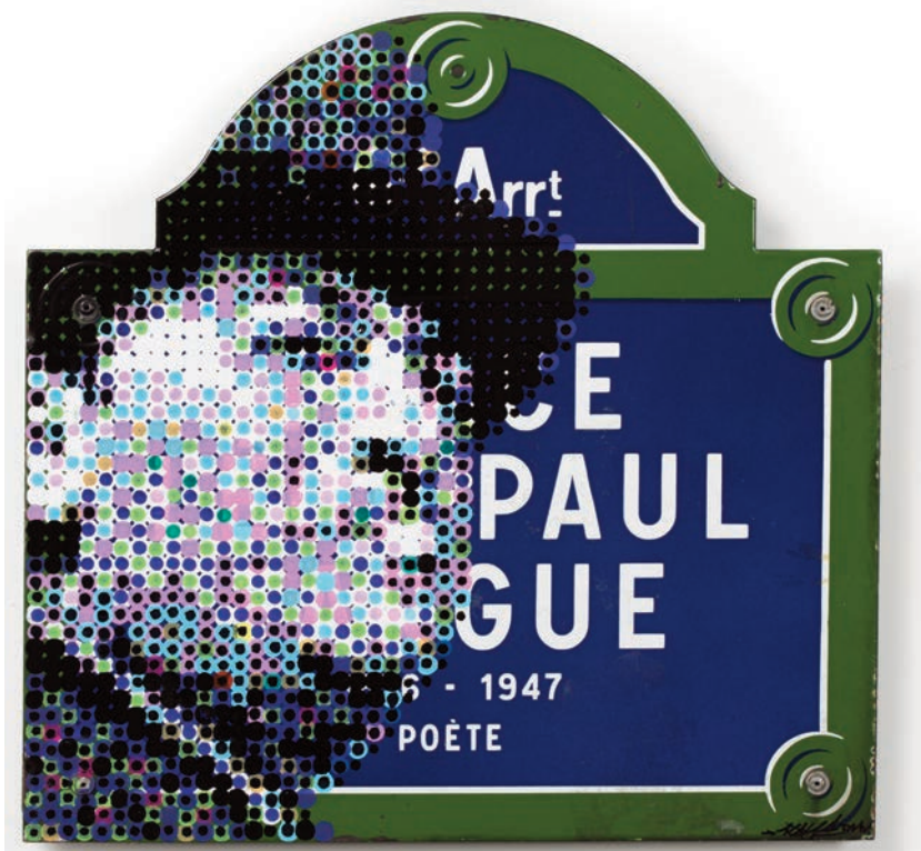
KAN , Place Jean-Paul Fargue , 2015, marqueur sur plaque de rue émaillée, 49 x 50 cm © Alain Smilo