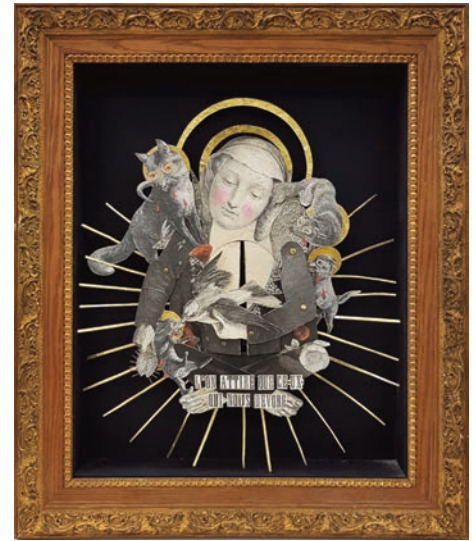
MADAME , L'on attire ce-ux qui nous dévore , 2018, technique mixte, 62 x 52 cm © Madame