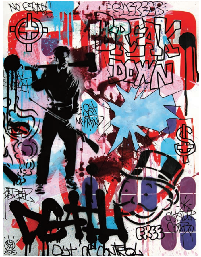
SPEEDY GRAPHITO , Break Down , 2015, technique mixte sur papier, 65 x 50 cm © Speedy Graphito