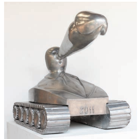
S. TEDDY D. , Phallus Tank , 2011, aluminium, 105 x 72 x 140 cm © Galerie Wallworks