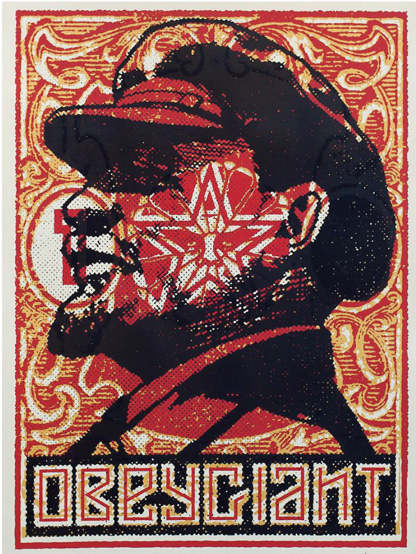
SHEPARD FAIREY , Lenine Stamp , 2018, sérigraphie sur papier, 77/90, 93 x 71 cm © Shepard Fairey