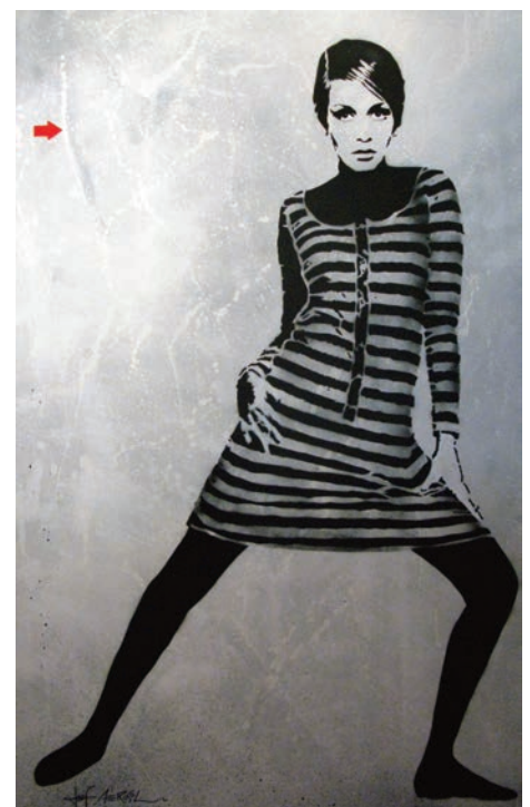
Jef AÉROSOL , Twiggy , 2012, technique mixte sur toile, 190 x 120 cm © Jef Aérosol