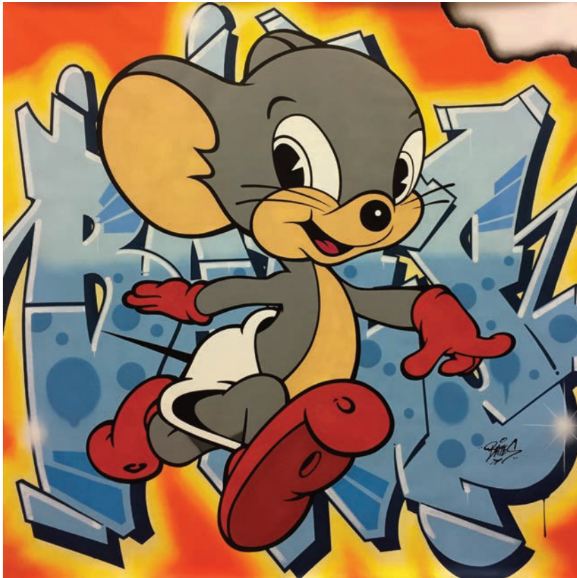
BATES , Mouse Trap , 2018, acrylique, encre aérosol et marqueur sur toile, 147 x 147 cm © Bates