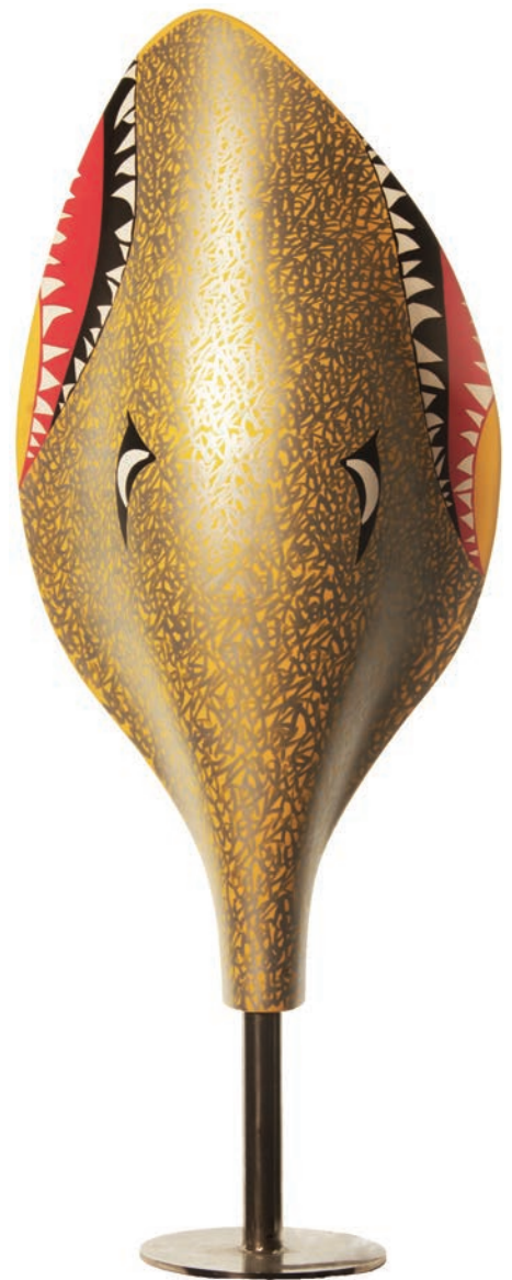
COLORZ , Sans titre , 2012, encre aérosol, marqueur et acrylique sur lampe Manta, 137 x 54 x 28 cm © Arthur Laforge