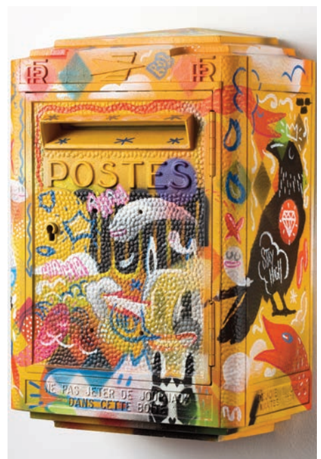
GILBERT , Sans titre , 2013, encre aérosol et marqueur sur boîte postale, 41 x 26 x 17 cm © Alain Smilo