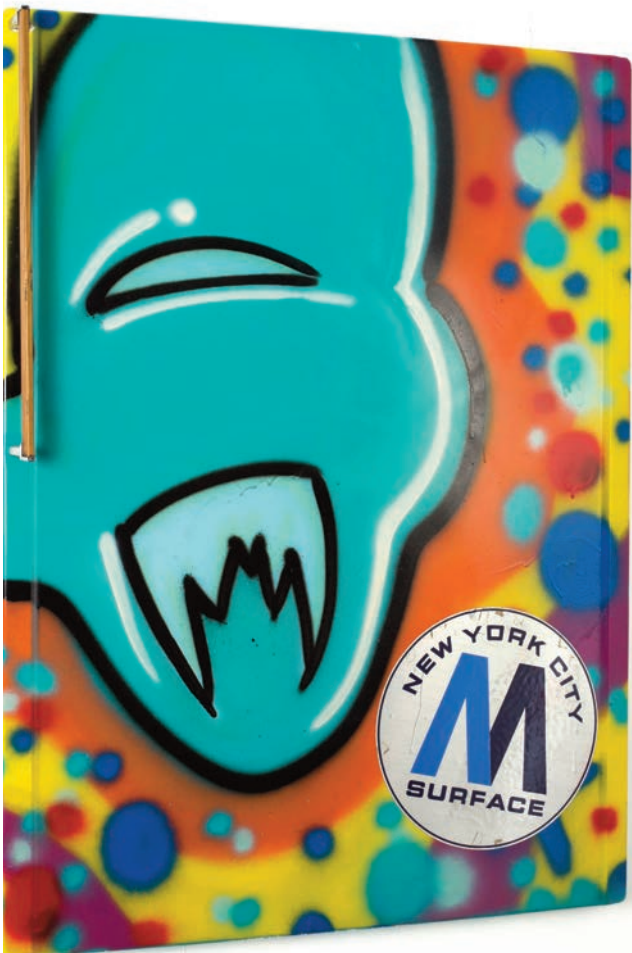
QUIK , A Tribute , 1984, technique mixte sur porte de réfrigérateur américain, 122 x 62 x 8 cm © Alain Smilo