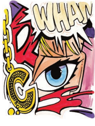
CRASH , Stamped for Life #32, #6, #16 et #4, 2012, aquarelle et encre de Chine sur papier, 76 x 57 cm © Alain Smilo