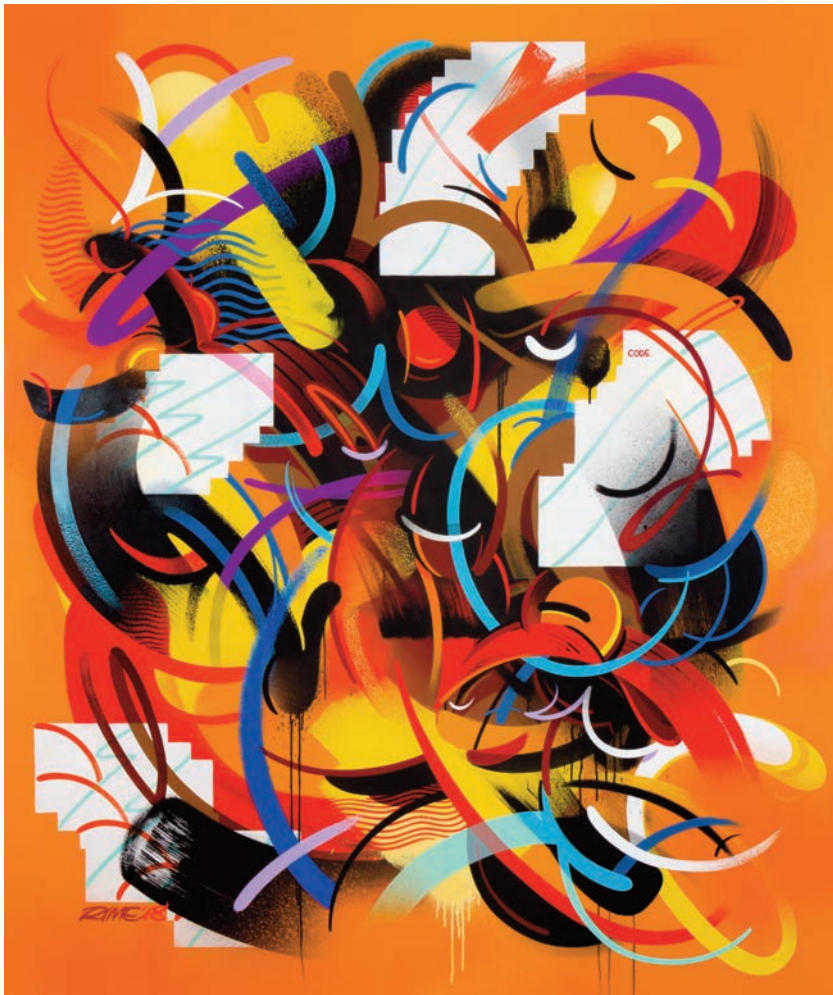
RIME , Code , 2018, acrylique et marqueur à l'huile sur toile, 182 x 151 cm © VIK NYC