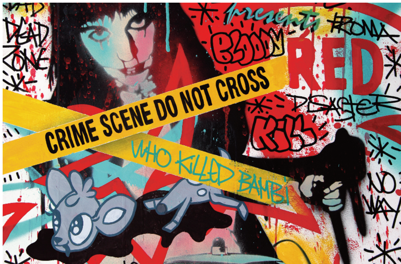
SPEEDY GRAPHITO , Crime Scene [détail], 2015, technique mixte sur papier, 65 x 50 cm © Speedy Graphito